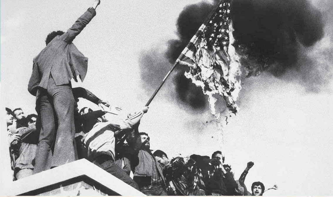
«ما دانشجویان مسلمان پیرو خط امام خمینی (ره)، ضمن دفاع از موضع قاطعانه امام در مقابل آمریکای جهان خوار، به منظور اعتراض به دسیسه‌های امپریالیستی و صهیونیستی، سفارت جاسوسی آمریکا در تهران را به تصرف در آورده‌ایم تا اعتراض خویش را به گوش جهانیان برسانیم.» بخشی از اطلاعیه دانشجویان مسلمان پیرو خط امام